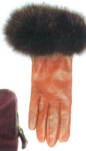
Gants en cuir et fourrure, GLOVE STORY , 89€.