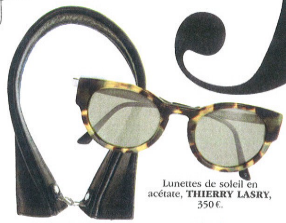
Lunettes de soleil en acétate, THIERRY LASRY , 350€.