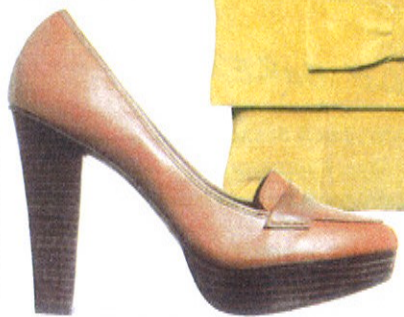
Mocassins à talons en cuir, H&M , 40€.