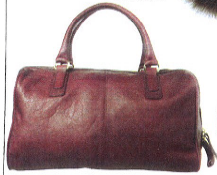
Sac bowling en cuir, MINELLI , 129€.