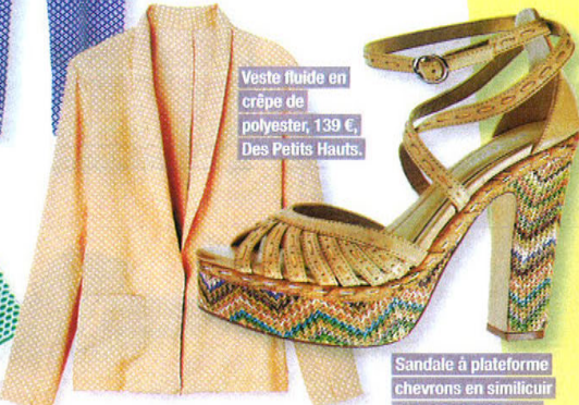
Veste fluide en crêpe de polyester, 139 €, Des Petits Hauts.