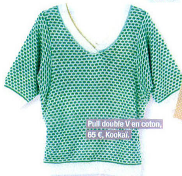
Pull double V en coton, 65 €, Kookai.