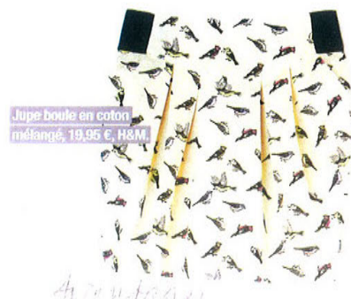
Jupe boule en coton mélangé, 19,95 €, H&M.