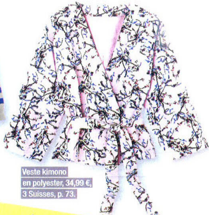
Veste kimono en polyester, 34,99 €, 3 Suisses, p. 73.