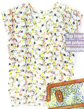
Top imprimé libellule en polyester, 30 €, Monoprix.