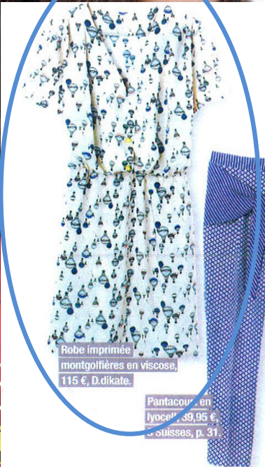
Robe imprimée montgolfières en viscose, 115 €, D.dikate.