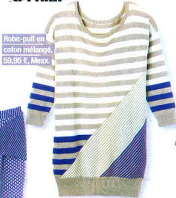
Robe-pull en coton mélangé, 59,95 €, Mexor.